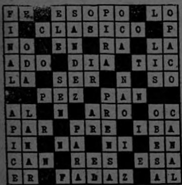
SOLUCION DEL CRUCIGRAMA No. 10

LA MATRICULA ESTARA ABIERTA desde el 4 al 15 de Febrero, todas las noches, de 7 a 9, en el Colegio de Señoritas (puerta costado Sur) después seguirá en la ESCUELA VITALIA MADRIGAL.